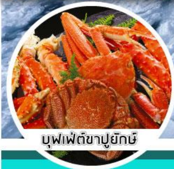
บุฟเฟ่ต์ชาปูยักษ์