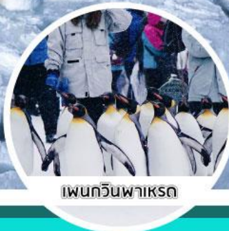
เพนกวินพาเหรด