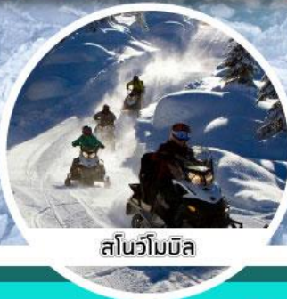
สโนว์โอมบิล